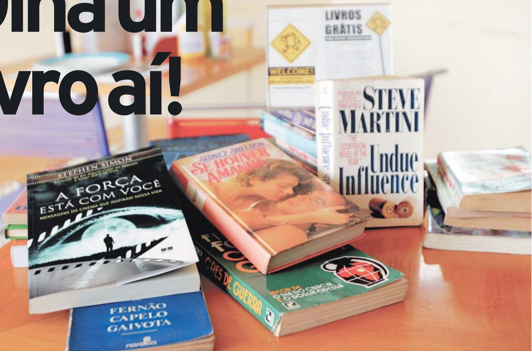
Livros gratuitos dentro do restaurante Central das Artes, em Perdizes. A casa é a primeira a trazer ao Brasil um projeto chamado BookCrossing, no qual basta retirar um exemplar e cadastrá-lo em um site. A palavra de ordem é confiança